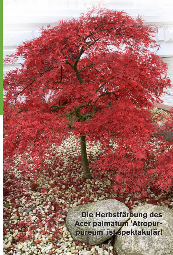
Die Herbstfärbung des Acer palmatum 'Atropurpureum' ist spektakulär!

Manche Ahorne treiben im Frühjahr rot aus,